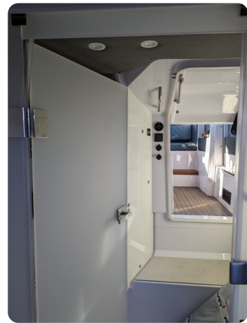
Axopar 37 XC cabin entrance