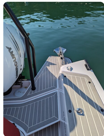
Axopar 37 XC stern detail