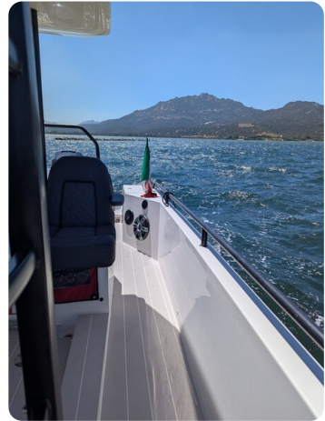
Axopar 37 Sun Top Brabus, side view