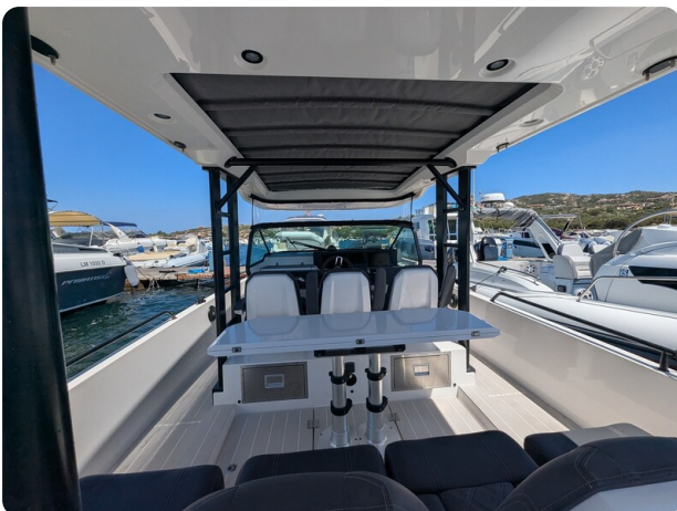
Axopar 37 Sun Top Brabus, cockpit view