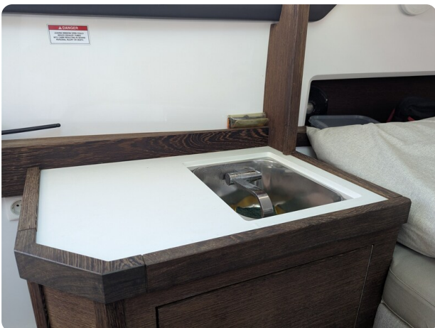
Axopar 37 Sun Top Brabus, cabin detail