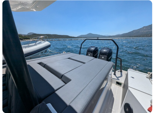
Axopar 37 Sun Top Brabus, aft sunpad