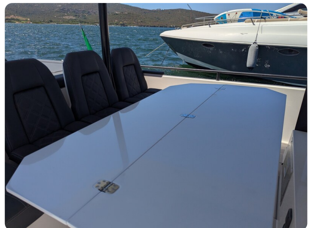
Axopar 37 Sun Top Brabus, table detail