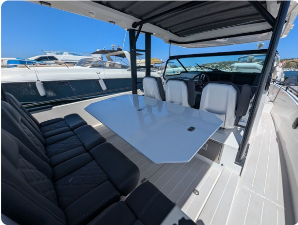
Axopar 37 Sun Top Brabus, cockpit dinette