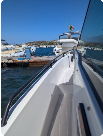
Axopar 37 Sun Top Brabus, port side view