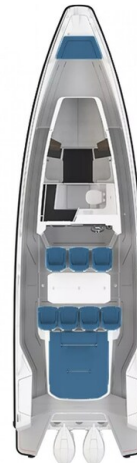
Axopar 37 layout