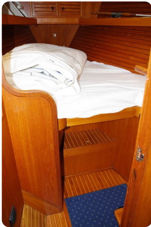
Avance 40 msp636285 9