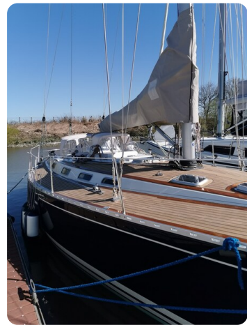
Avance 40 msp636285 6