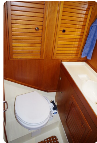
Avance 40 msp636285 10