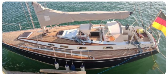
Avance 40 msp636285 1