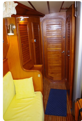
Avance 40 msp636285 12