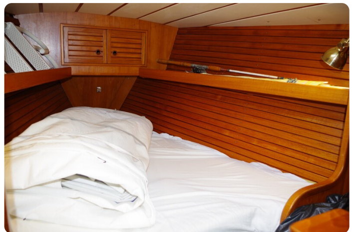
Avance 40 msp636285 8