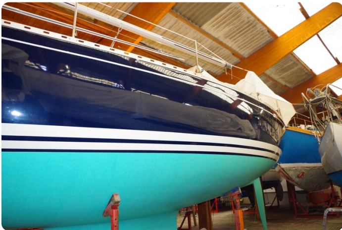
Avance 40 msp636285 23