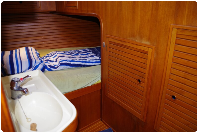
Avance 40 msp636285 21