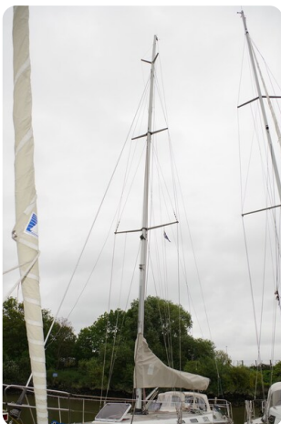
Avance 40 msp636285 7