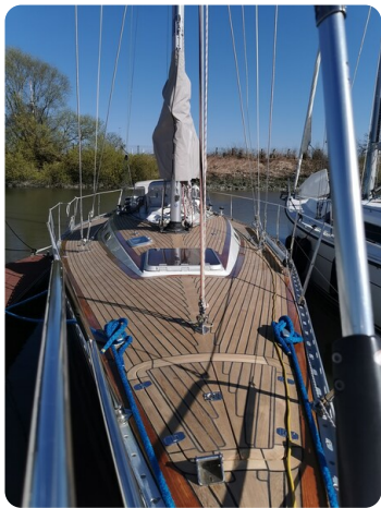
Avance 40 msp636285 5