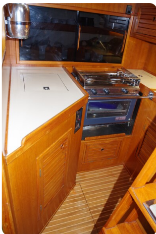
Avance 40 msp636285 19