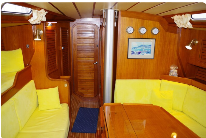
Avance 40 msp636285 13