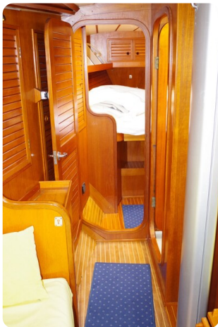
Avance 40 msp636285 11