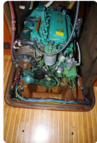
Avance 40 msp636285 22