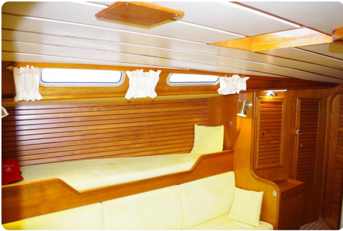
Avance 40 msp636285 15