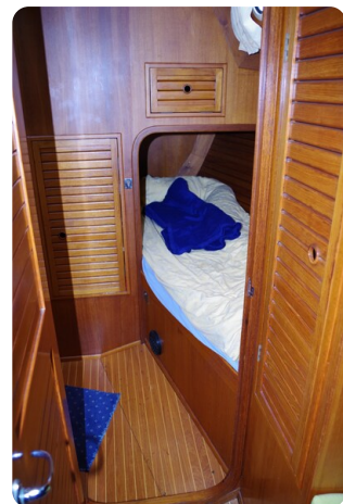
Avance 40 msp636285 20