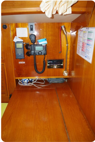
Avance 40 msp636285 17