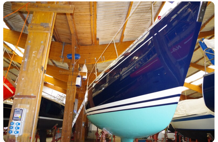
Avance 40 msp636285 24