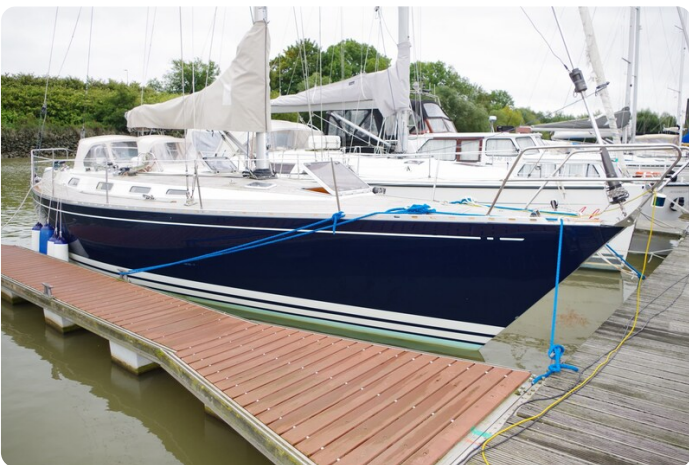
Avance 40 msp636285 2