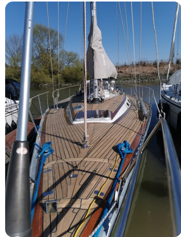
Avance 40 msp636285 4