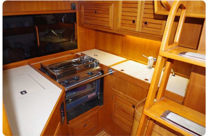
Avance 40 msp636285 18