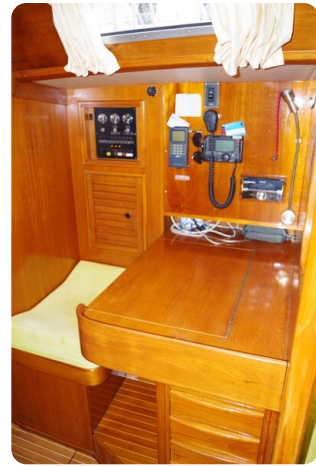
Avance 40 msp636285 16