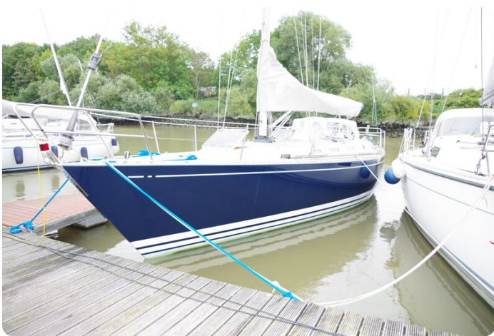
Avance 40 msp636285 3