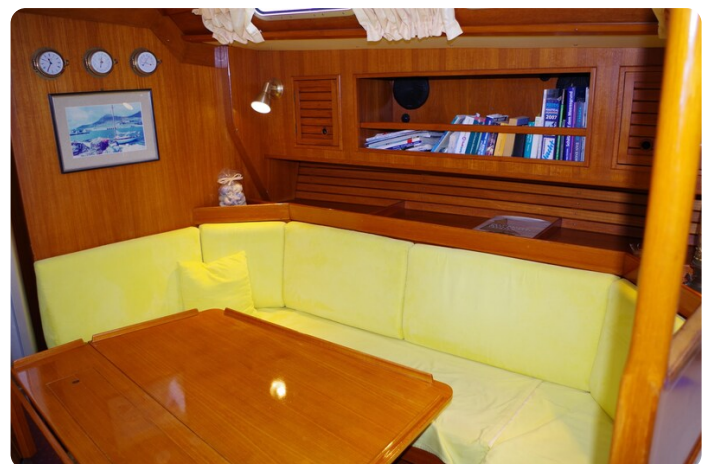
Avance 40 msp636285 14