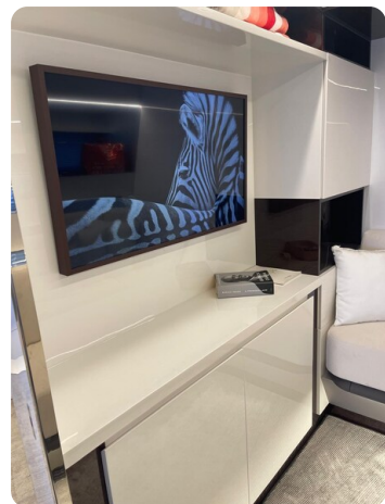
CIAO! room details