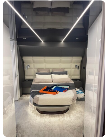
CIAO! cabin details