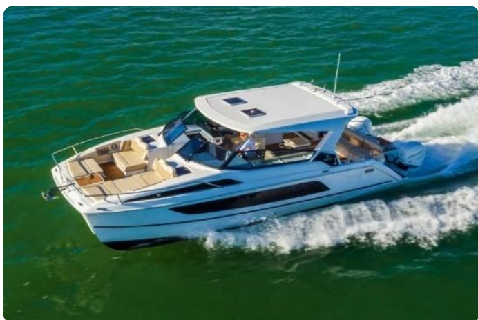
Aquila 36 Sport sistership