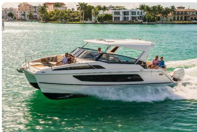
Aquila 36 Sport sistership