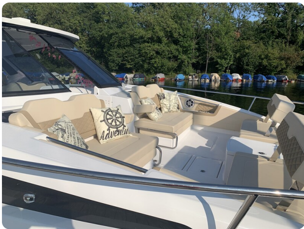
Aquila 36 Sport bow dinette