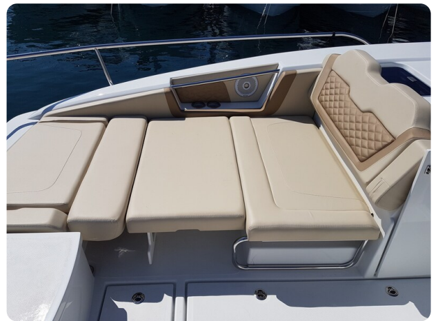
Aquila 36 Sport sunpad