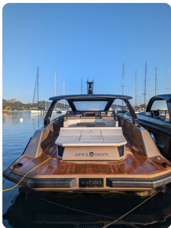
Apex 60 stern view