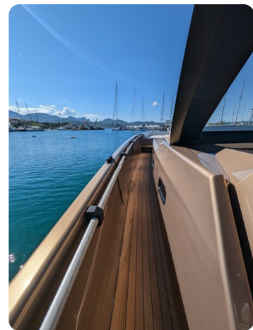
Apex 60 sideways