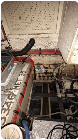
Grand Banks 48_msp789980 10