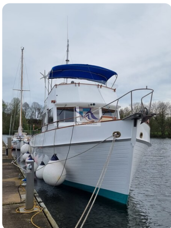
Grand Banks 48_msp789980 2