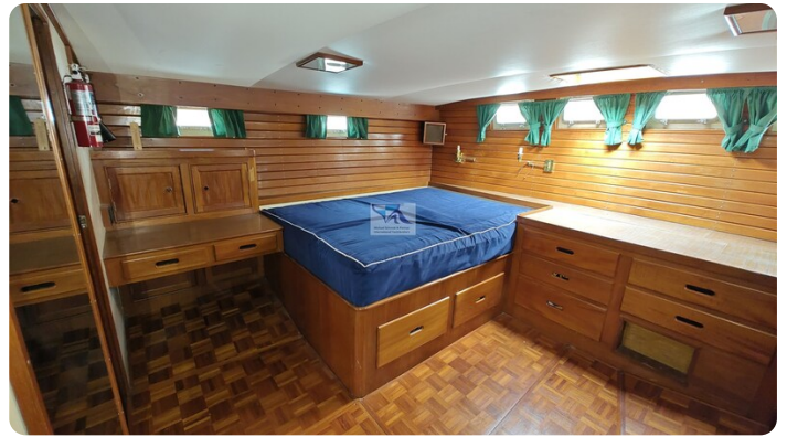
Grand Banks 48_msp789980 48