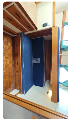
Grand Banks 48_msp789980 22