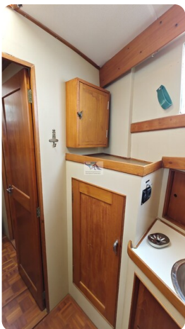
Grand Banks 48_msp789980 27