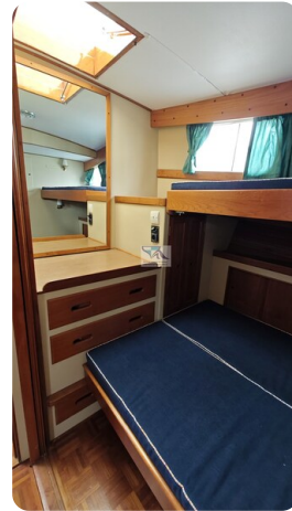
Grand Banks 48_msp789980 18