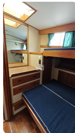
Grand Banks 48_msp789980 18