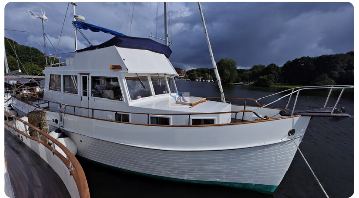
Grand Banks 48_msp789980 66