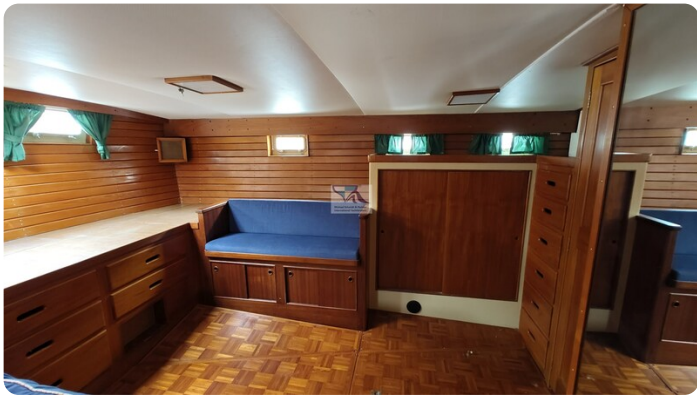
Grand Banks 48_msp789980 51