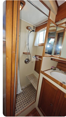
Grand Banks 48_msp789980 41