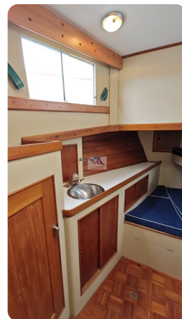
Grand Banks 48_msp789980 29