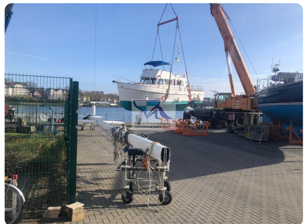
Grand Banks 48_msp789980 1