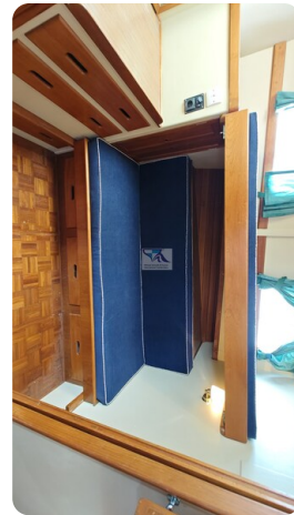
Grand Banks 48_msp789980 22