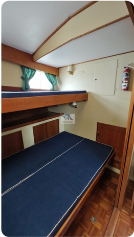
Grand Banks 48_msp789980 17