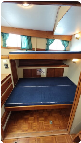
Grand Banks 48_msp789980 19