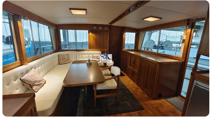
Grand Banks 48_msp789980 85