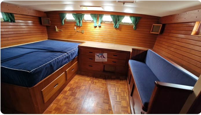
Grand Banks 48_msp789980 50