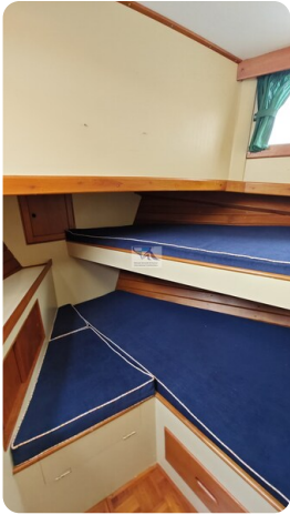
Grand Banks 48_msp789980 31