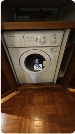
Grand Banks 48_msp789980 100