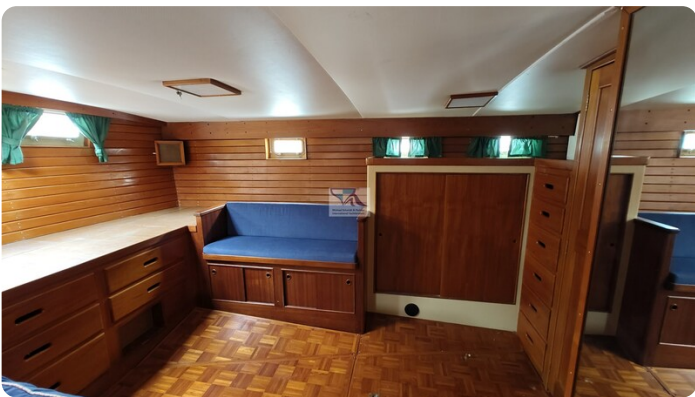
Grand Banks 48_msp789980 51