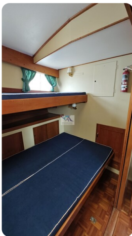
Grand Banks 48_msp789980 17