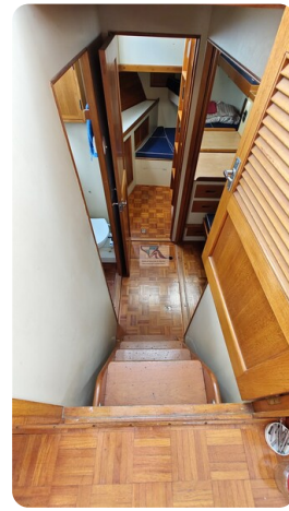
Grand Banks 48_msp789980 16