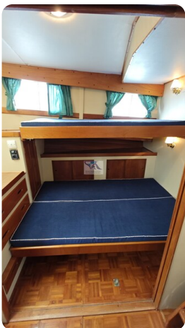
Grand Banks 48_msp789980 19