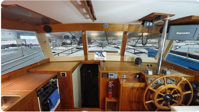
Grand Banks 48_msp789980 92