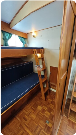
Grand Banks 48_msp789980 23