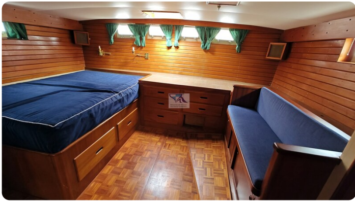
Grand Banks 48_msp789980 50