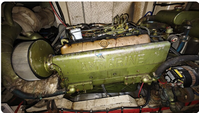
Grand Banks 48_msp789980 6