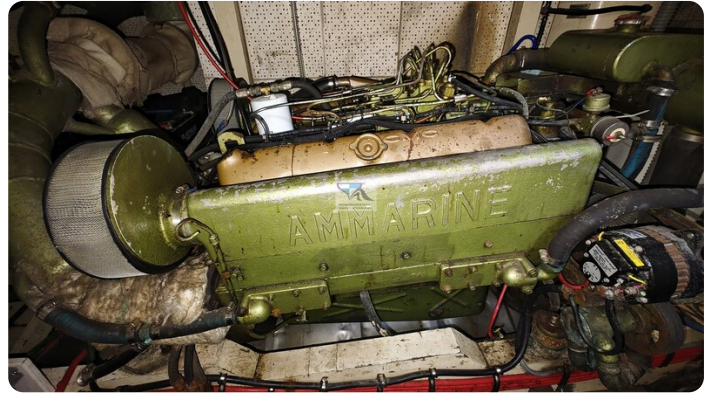
Grand Banks 48_msp789980 6