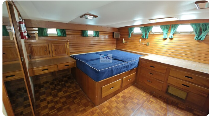
Grand Banks 48_msp789980 48