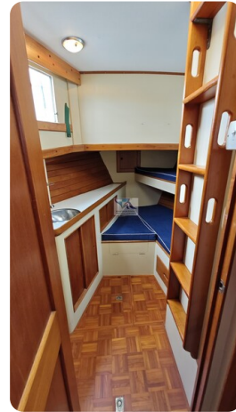
Grand Banks 48_msp789980 25