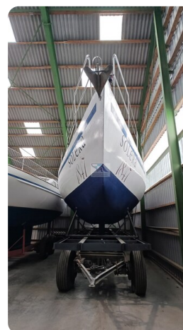
Feltz Alu One Off_2