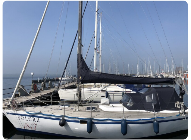
Feltz Alu One Off_113