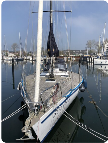
Feltz Alu One Off_111