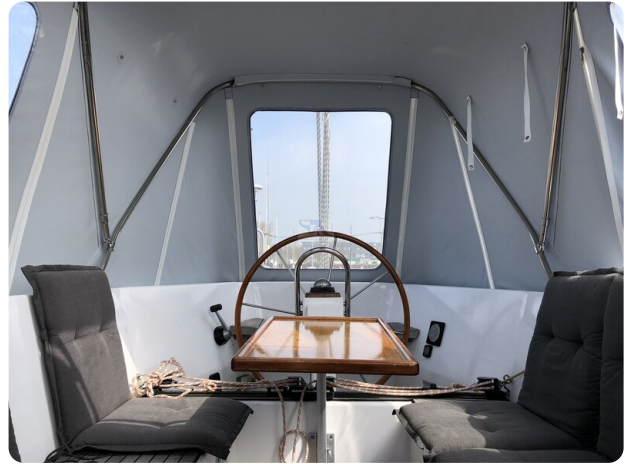
Feltz Alu One Off_89