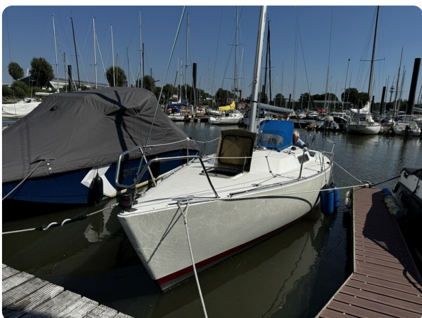
Albin Express 1