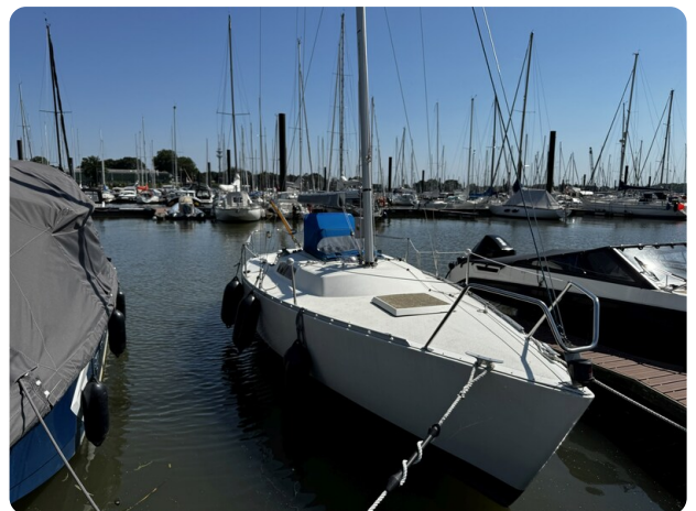
Albin Express 31